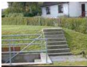
Adgang til beholder

Mandelugen til rentvandsbeholderen er et rustfrit overfalset dæksel hævet over terræn.