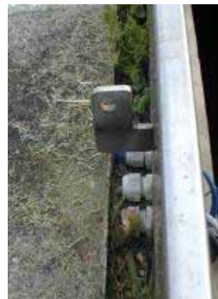
Kabelgennemføringer i dækselkarm er uheldig placeret nær ved terræn, hvilket kan føre til vandindtrængning.