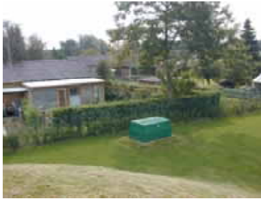
Parcelhuskvarter omkring vandværket