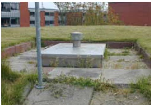
Mandeluge med flisebelægning

Mandelugen til rentvandsbeholderen er et rustfrit overfalset dæksel hævet over terræn. Der er anlagt fliser omkring dækslet.