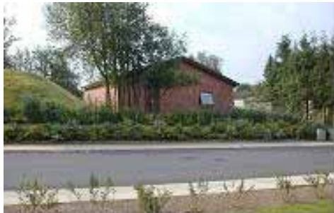
Vandværket Asser Rigs Vej